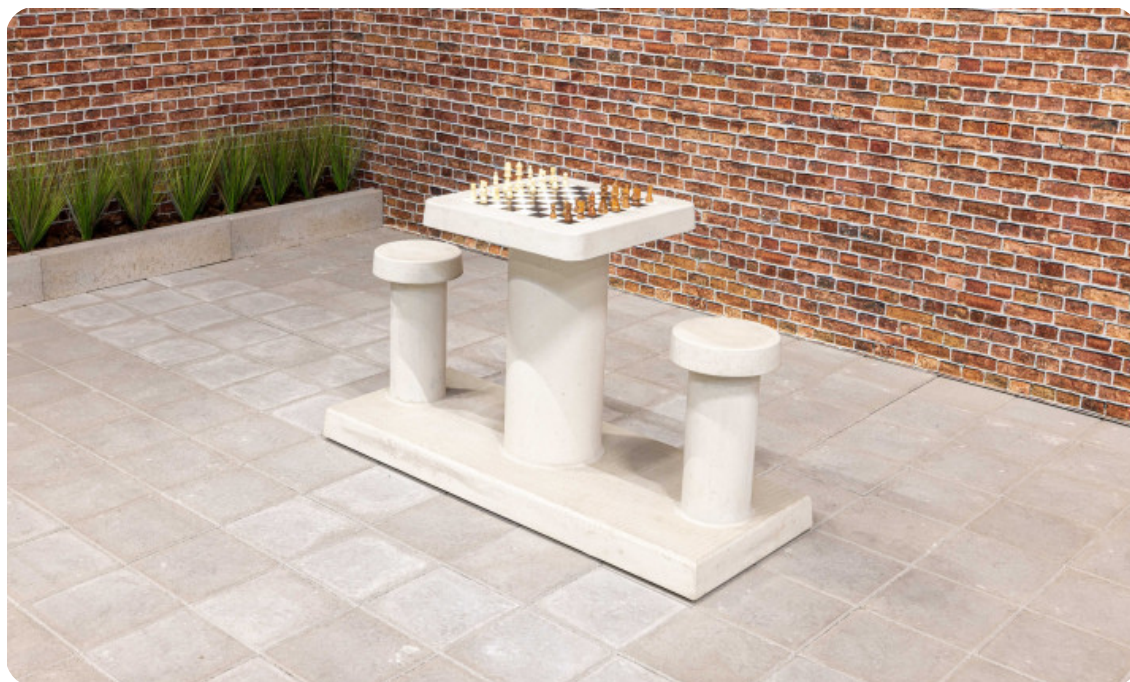
Table d'échecs en béton naturel 2 personnes