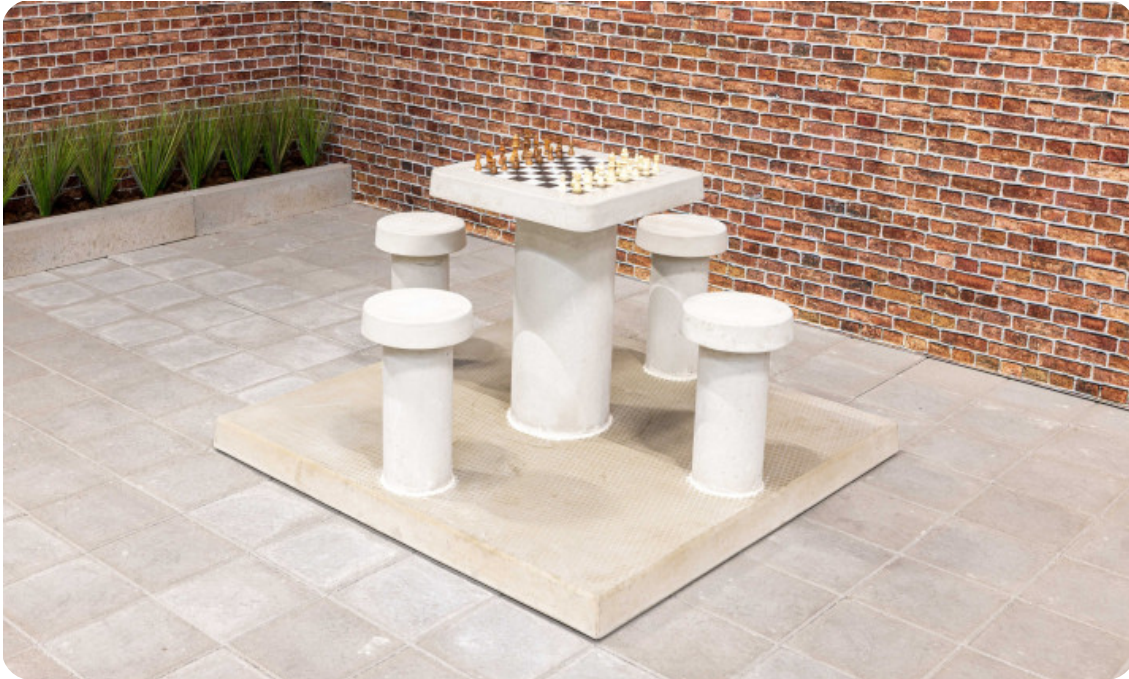
Table d'échecs en béton naturel, 4 personnes